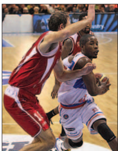
Un momento di Brindisi-Pistoia

Il presidente biancoazzurro chiede l'aiuto di tutti (pubblico, tifosi, amici e giocatori) e torna sulla controversa questione del palasport dopo aver rappresentato polemicamente le ragioni societarie e aver lanciato una sorta di ultimatum al governo cittadino guidato da Mimmo Consales. La mancanza di un impianto adeguato alle esigenze di un campionato prestigioso come la serie A e la limitazione degli introiti di varia natura (pubblico, sponsor e attività collaterali), penalizza sensibilmente l'impegno dei soci della NBB,